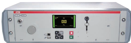
D620 19" 3HE-Gehäuse