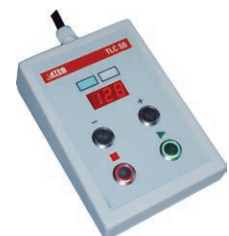
TLC 60 Fernbedienung