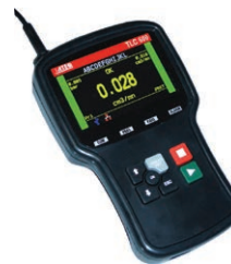
TLC 600 Fernbedienung